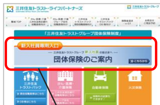
「新入社員専用入口」 パナからお手続きください