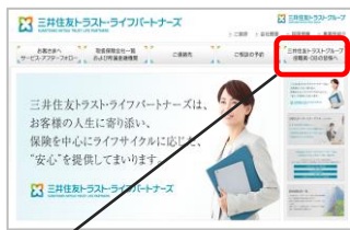
「三井住友トラストグループ」 役職員・OBの皆様へ