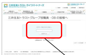
皆さまのパスワード「smtg」 (半角小文字) を入力